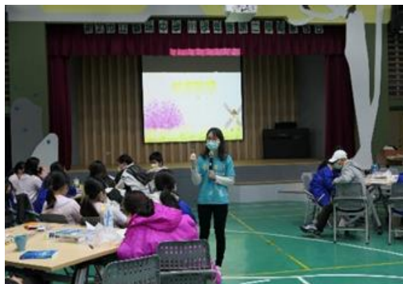
透過家長日的親師生交流活動，讓親師生能夠更進一步的互動交流