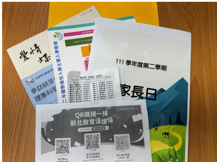
家長日 資料袋放置親職教育相關宣導文宣