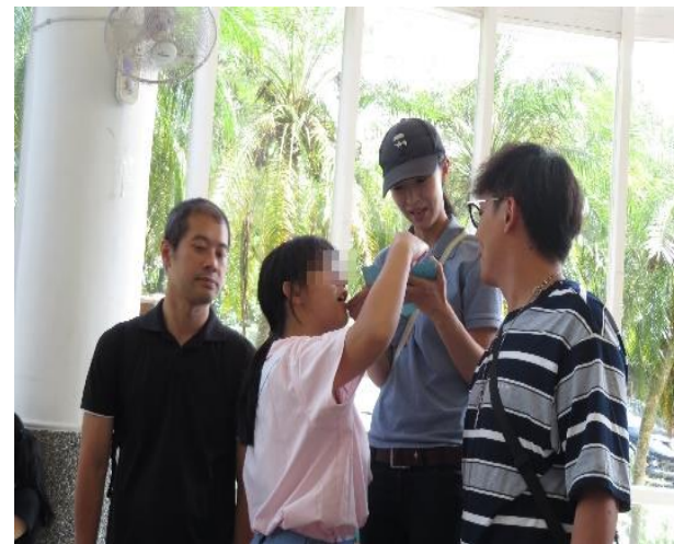
學生給家長的手作書