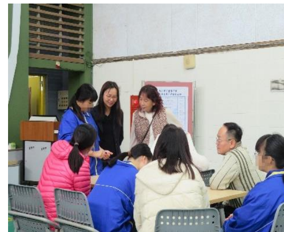
學生分享心得給家長