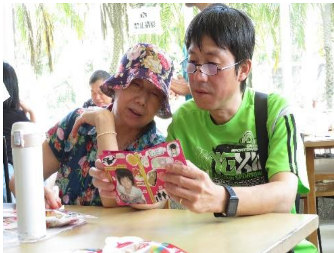
學生給家長的手作書