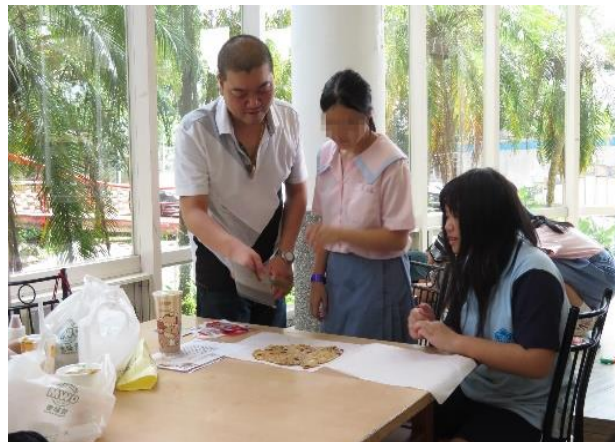
親子共作甜點時光