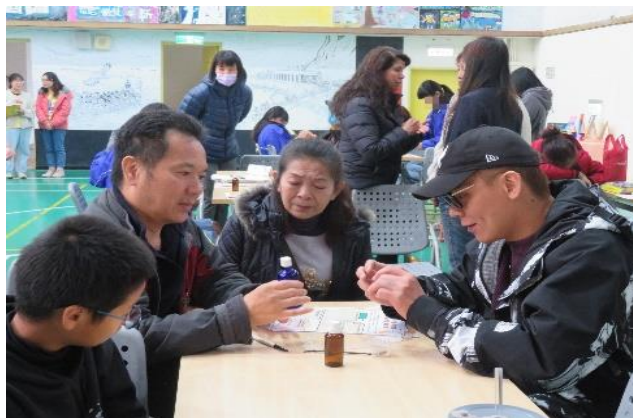
學生分享心得給家長