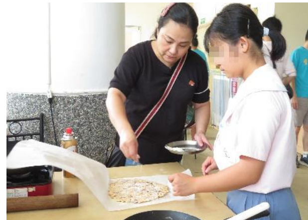
親子共作甜點時光