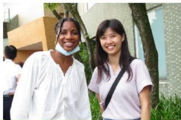
雙中老師一同參與