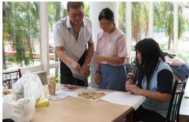
親子共作甜點時光