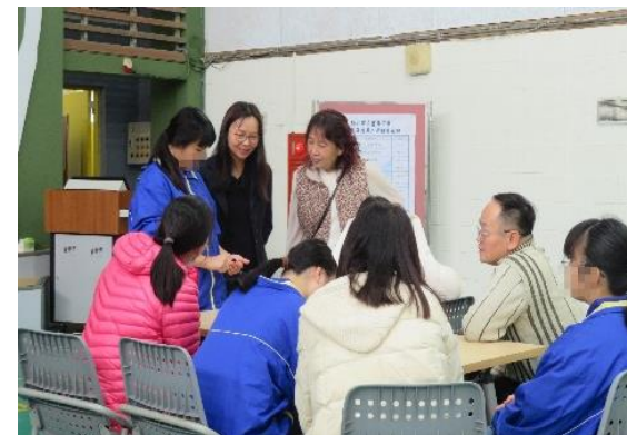
學生分享心得給家長