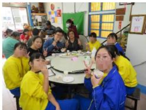
第二桌開飯拉~(學生)