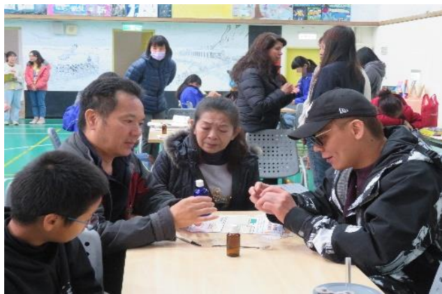
學生分享心得給家長