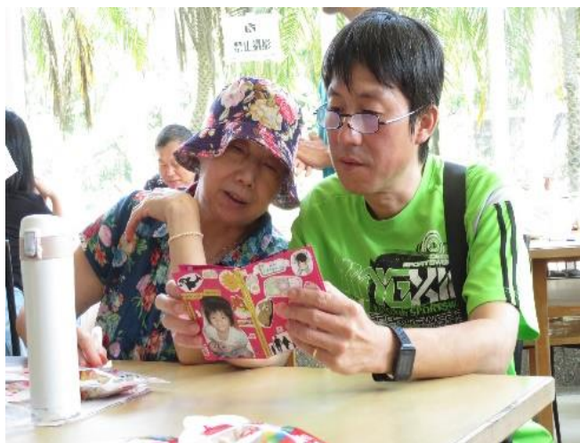
學生給家長的手作書