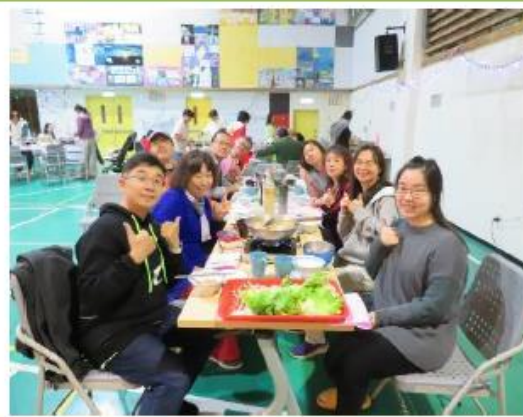
開心吃吃喝喝(貴賓)