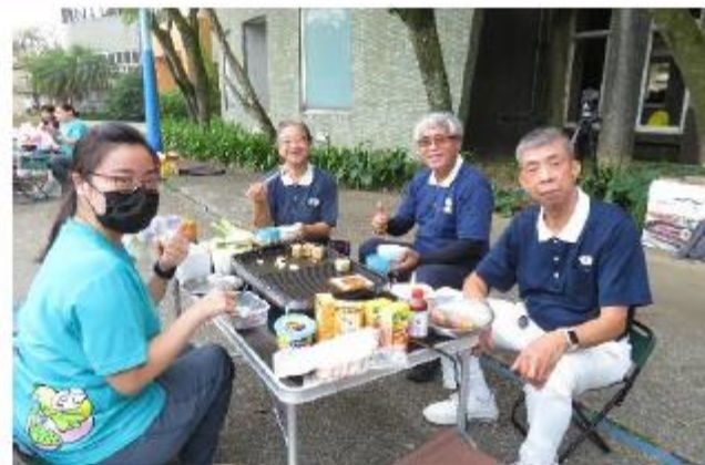
第一組烤肉趣&慈濟貴賓