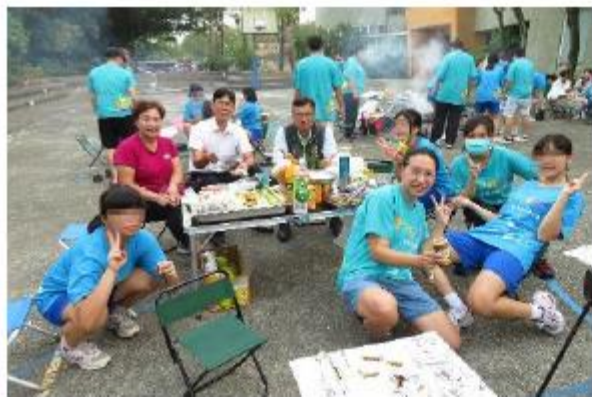
第五組烤肉趣&貴賓