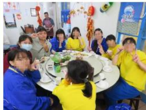
第三桌開飯拉~(學生)