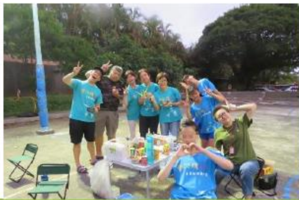
第三組烤肉趣&貴賓