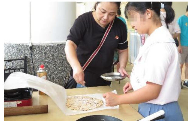
親子共作甜點時光