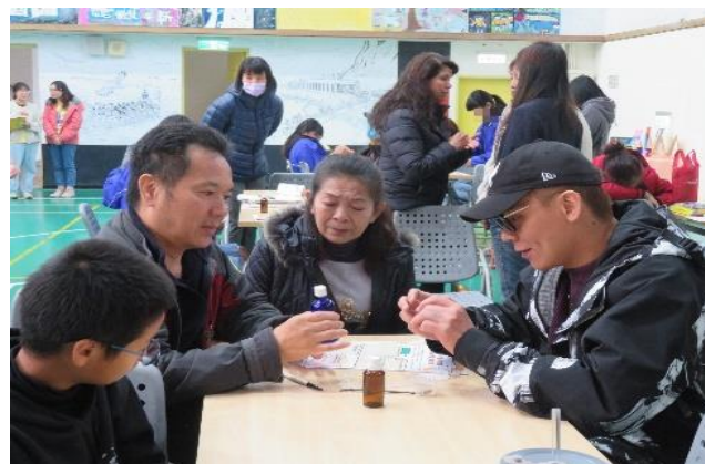
學生分享心得給家長