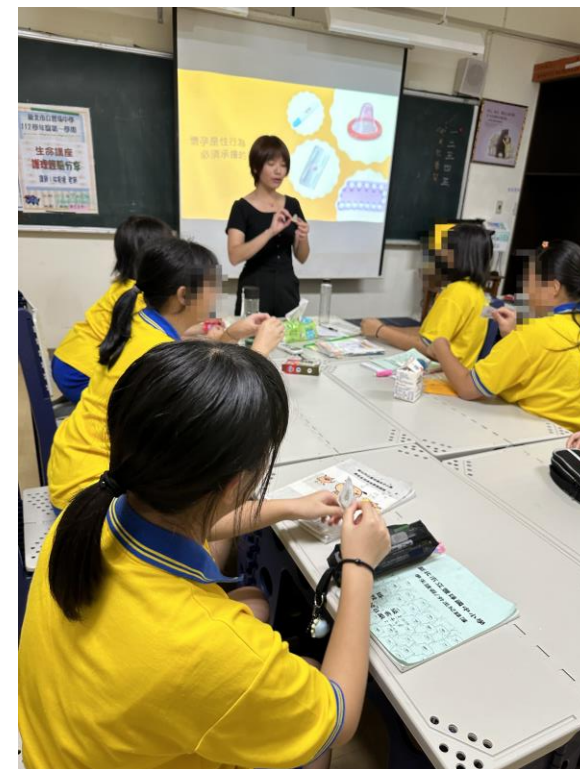
講師教學生正確使用保險套