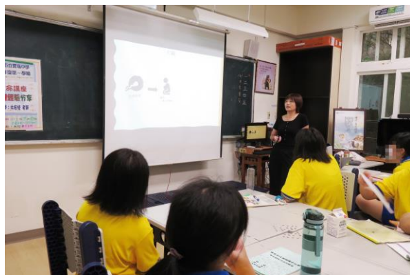
學生專心聆聽課程